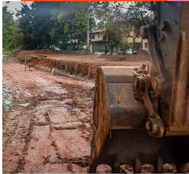
L. SANTANA/ESTADÃO EXPRESSO BAIRROS

A obra era uma reivindicação de moradores da favela da Ilha do Iguaçu, que convivem com enchentes nesse afluente do córrego do Oratório, na zona leste. A obra custou R$ 3,4 milhões. Sapopemba também recebeu duas obras de contenção de taludes e encostas desde 2021, no Jd. Elba e no Jd. Santa Madalena 1.