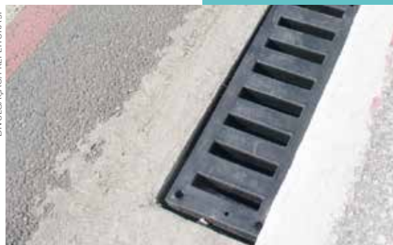
Grelha de plástico instalada na avenida Aricanduva

Em São Bernardo e na Capital paulista, a opção tem sido o polietileno rotomoldado, mesmo material utilizado em caixas