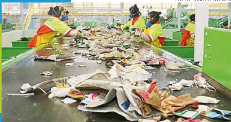
Trabalho de reciclagem da Prefeitura

toneladas de resíduos são geradas por dia na Capital