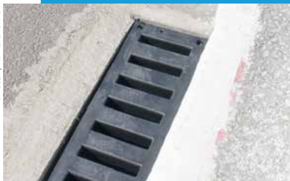
Grelha de plástico instalada na avenida Aricanduva

Em São Bernardo e na Capital paulista, a opção tem sido o polietileno rotomoldado, mesmo material utilizado em caixas